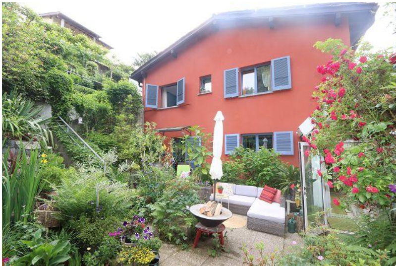
Sitzplatz / cortile