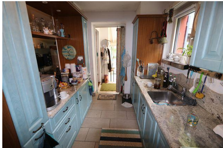
Küche / cucina