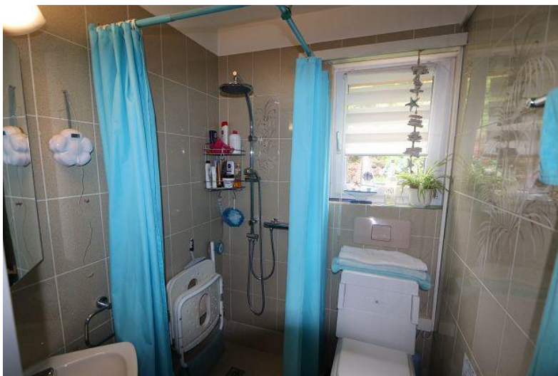
Dusche / doccia