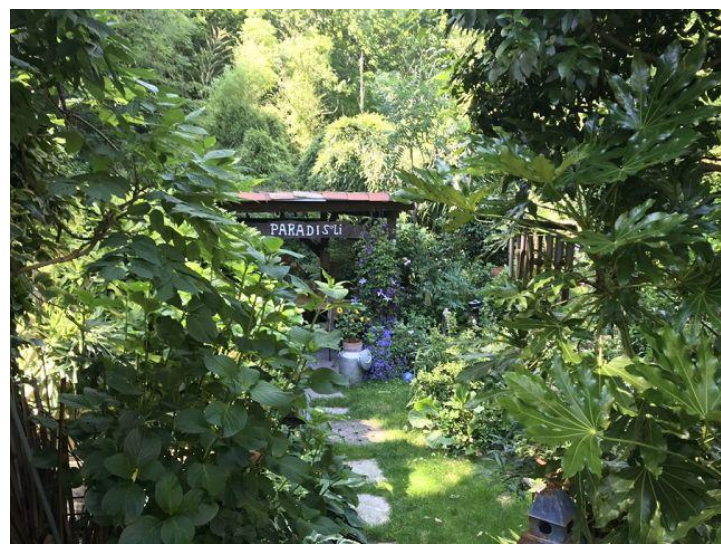
Gartenanlage / giardino