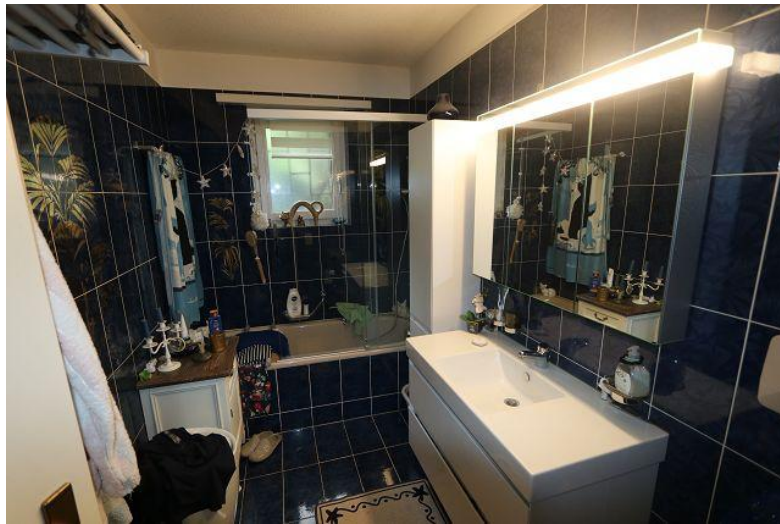
Bad / bagno