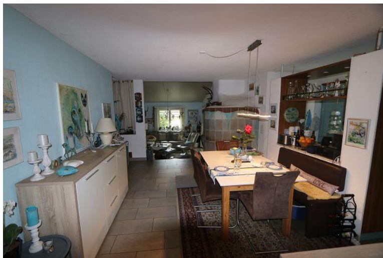
Essraum / pranzo