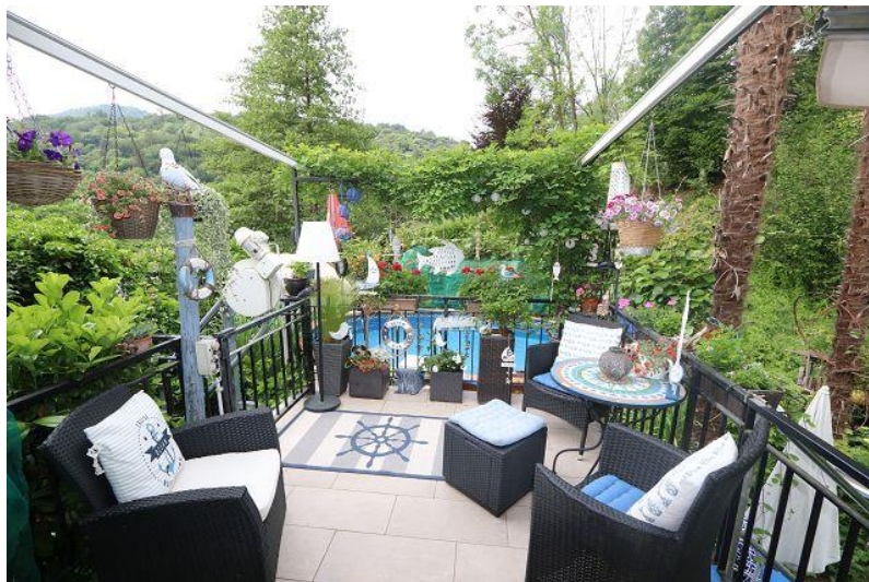
Balkon / balcone