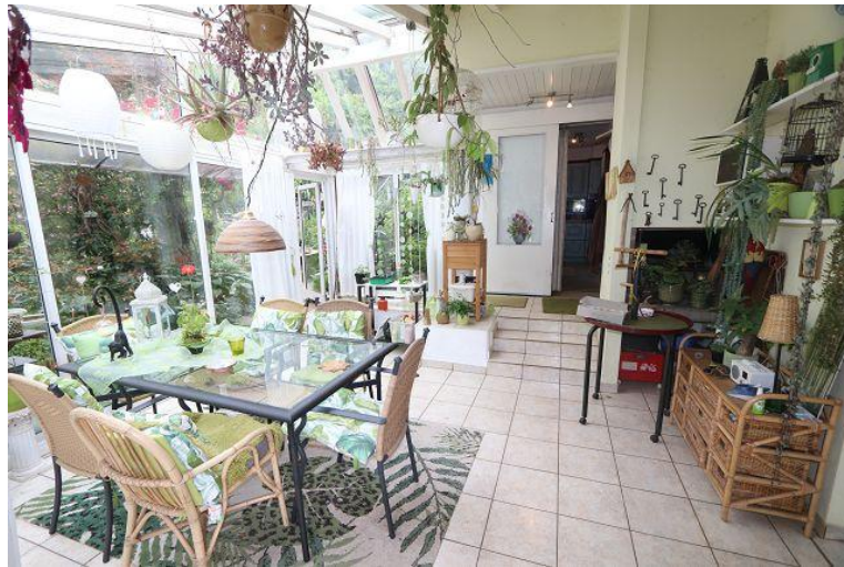
Wintergarten / giardino d'inverno