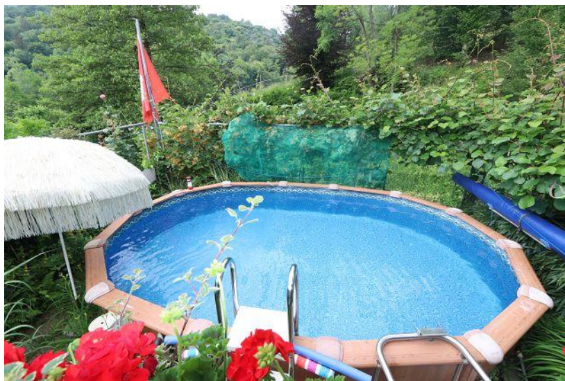
Schwimmbad / piscina