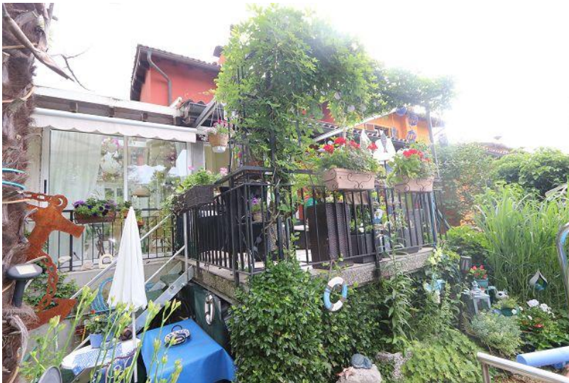
Haus mit Terrasse / casa con terrazza