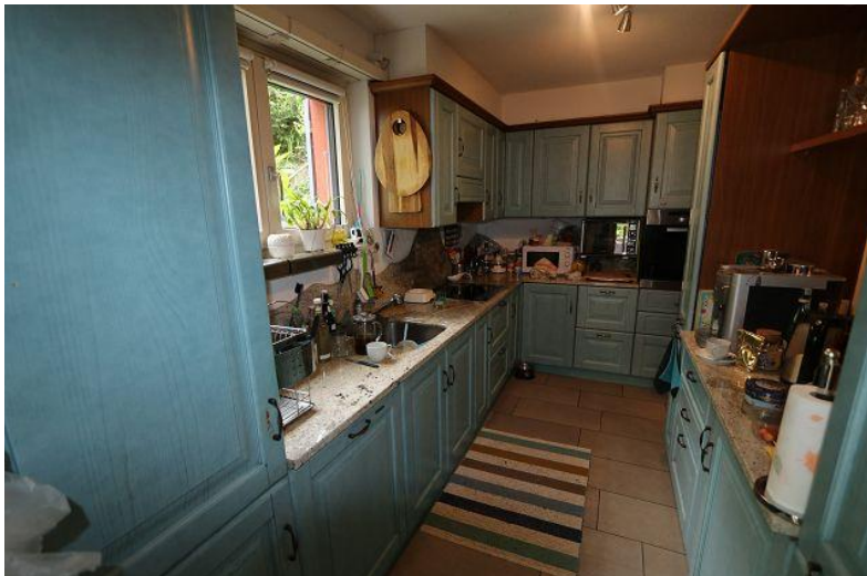
Küche / cucina