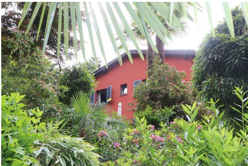
Haus / casa