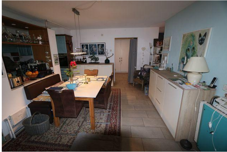
Essraum / pranzo