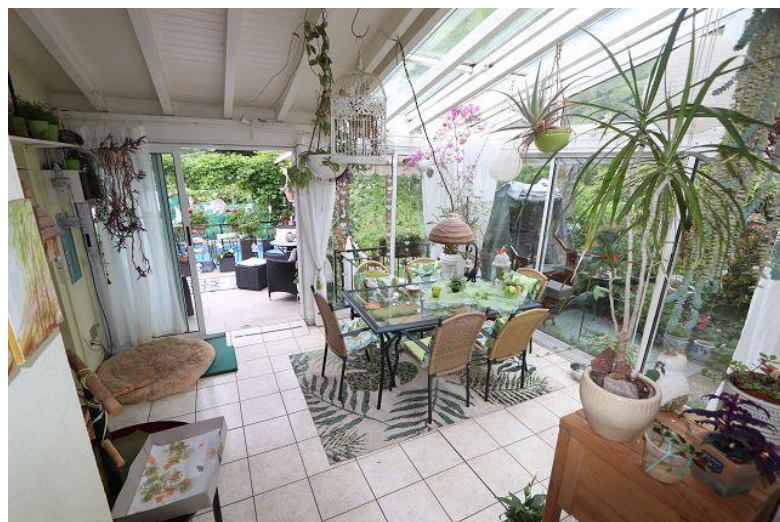
Wintergarten / giardino d'inverno