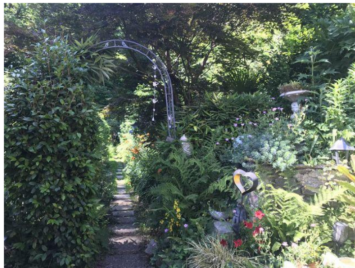
Gartenanlage / giardino