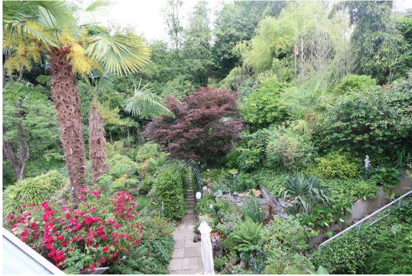
Gartenanlage / giardino