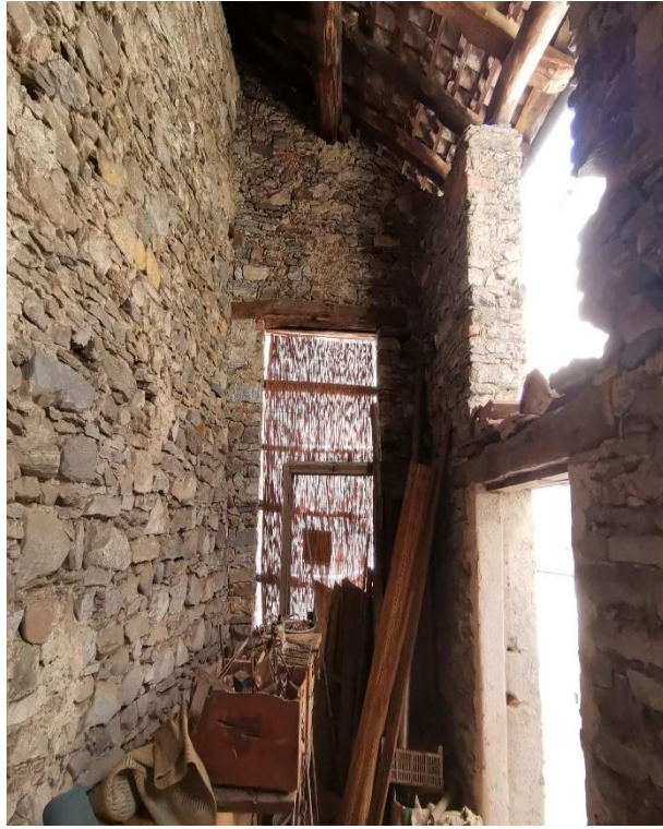
Haus außen / interno rustico piccolo