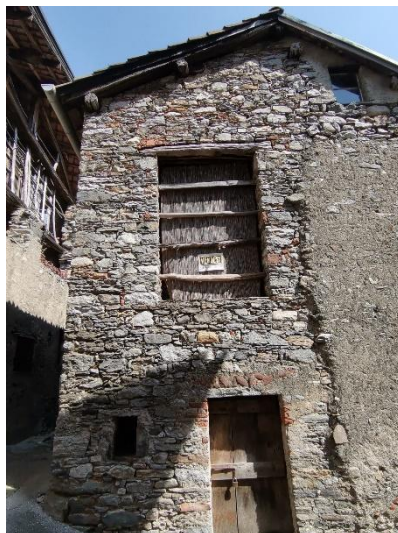
Kleines Rustico / rustico piccolo