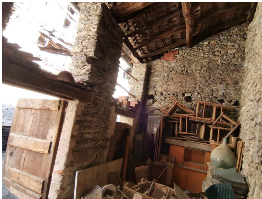
Innenraum kleines Rustico / interno rustico piccolo