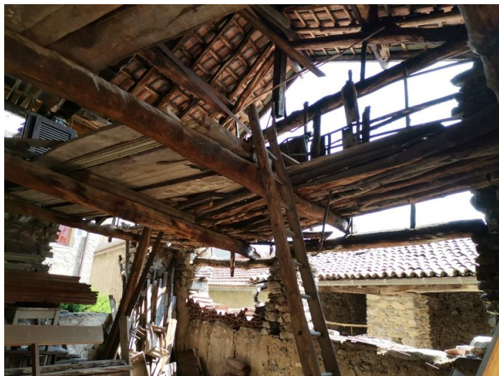
1. OG grosses Rustico / primo piano rustico grande