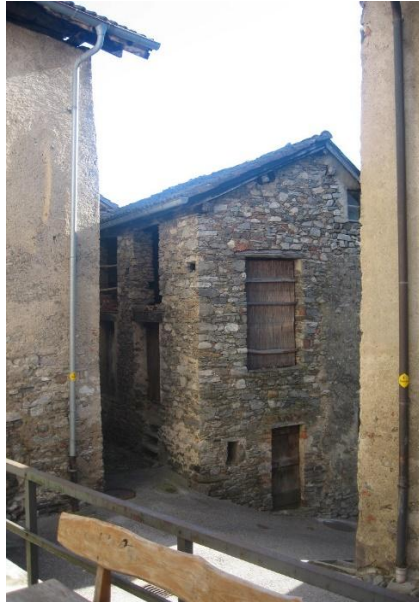
Fassade / esterno rustici