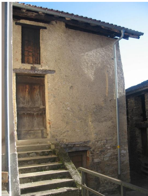
Großes Rustico / rustico grande