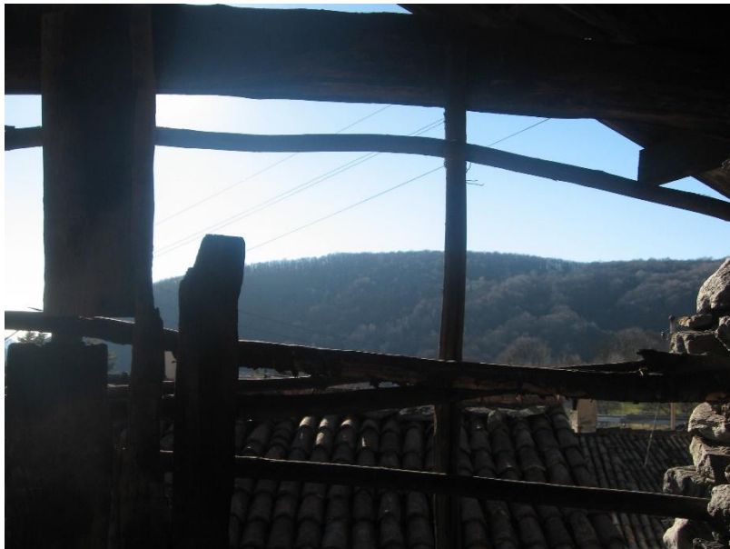
Aussicht vom grossen Rustico / vista dal rustico grande