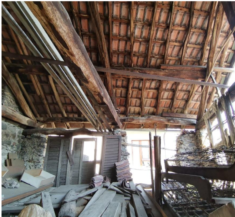
zweiter Stock grosses Rustico / secondo piano rustico grande