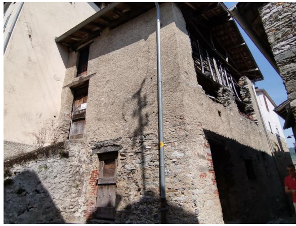
Großes Rustico / rustico grande