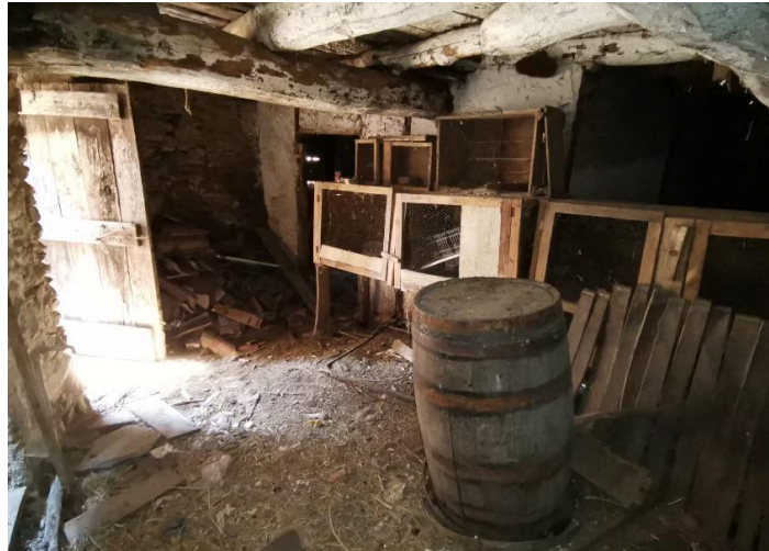
Keller / cantina rustico grande