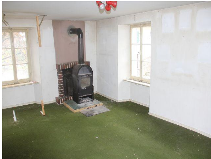
Küche und Wohnzimmer / cucina e pranzo