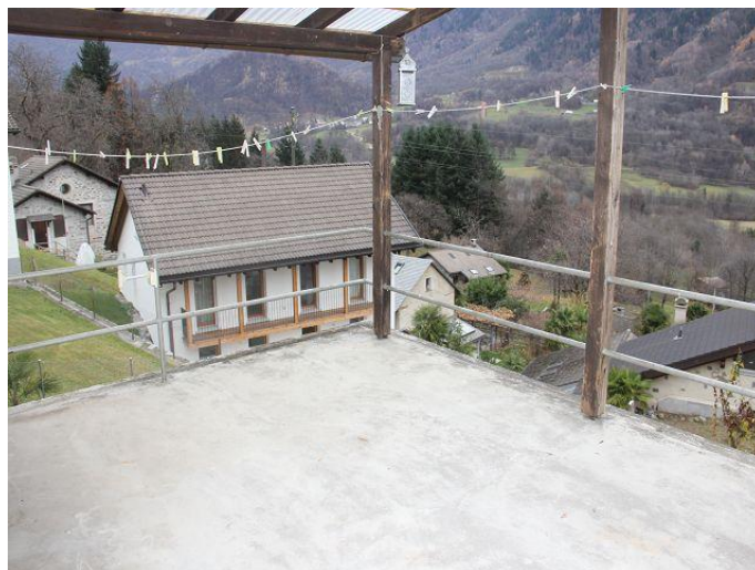
Terrasse / terrazza