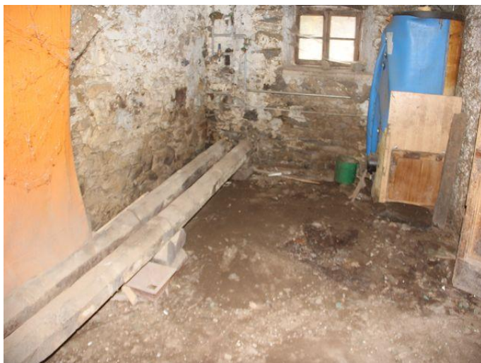
Keller / cantina