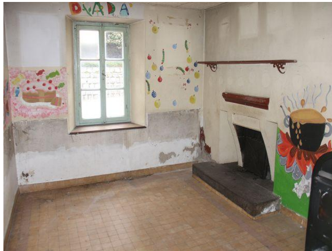
Küche und Wohnzimmer / cucina e pranzo