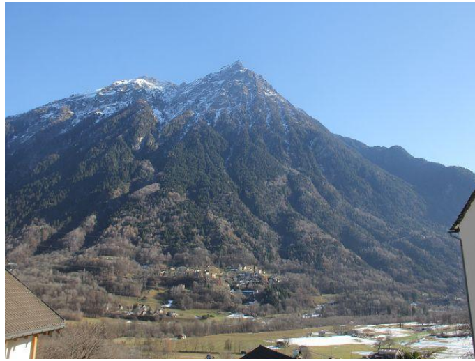
Blick nach Osten / vista est