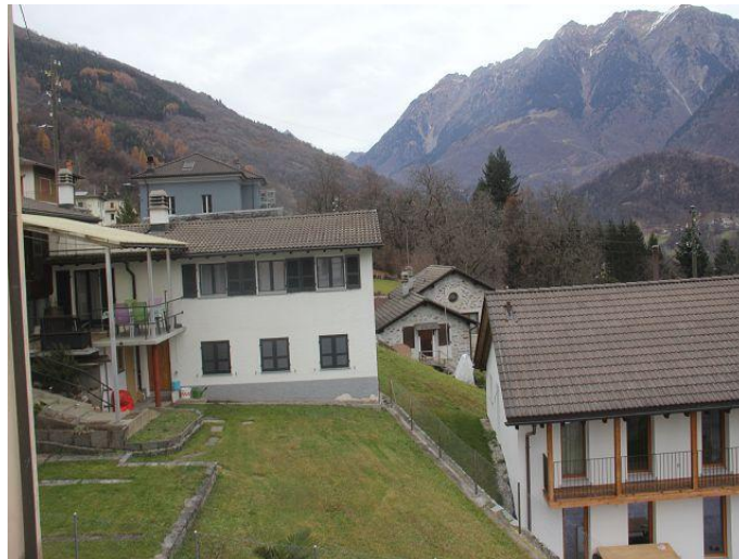
Blick nach Norden / vista nord