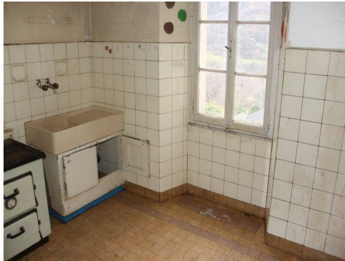
Küche und Wohnzimmer / cucina e pranzo