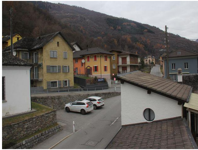
Blick auf öffentliche Parkplätze / vista verso posteggi pubblici