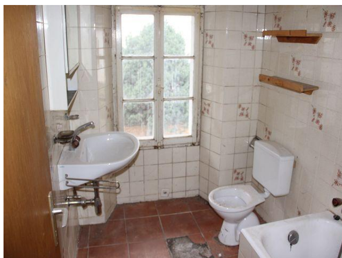
Bad / bagno