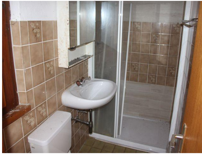
Dusche / doccia