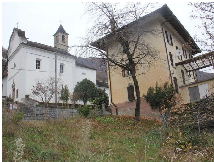
Garten und Haus / giardino e casa