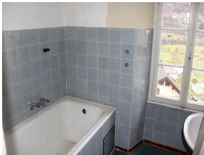
Küche und Wohnzimmer / cucina e pranzo