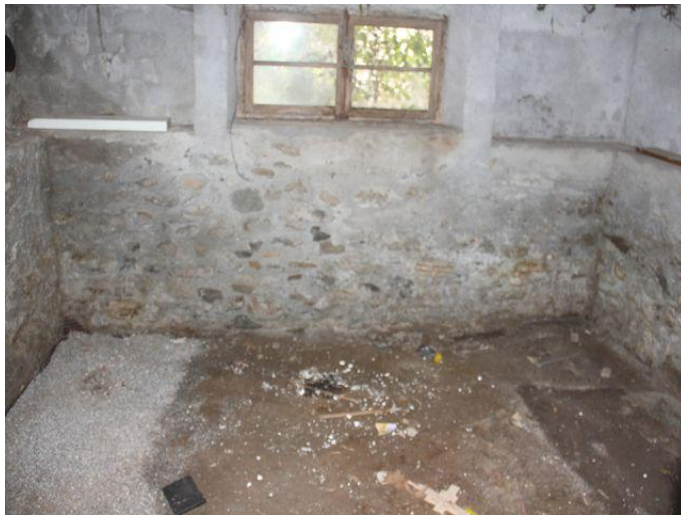
Keller / cantina