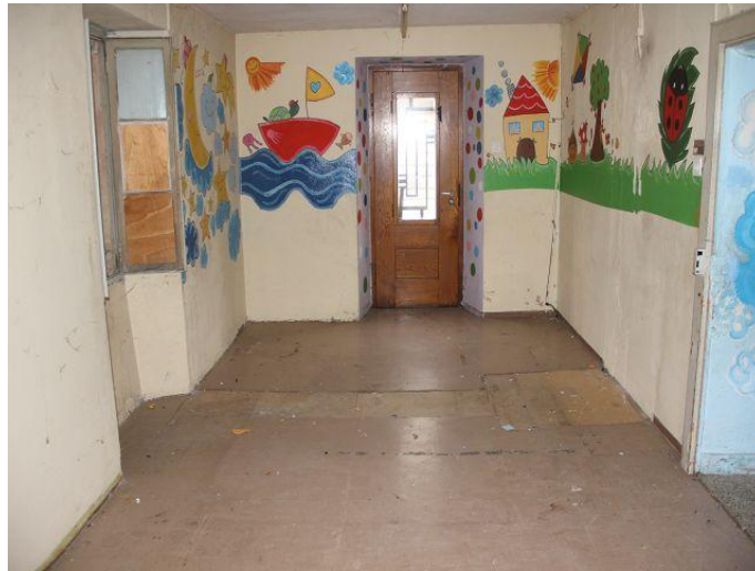
Küche und Wohnzimmer / cucina e pranzo