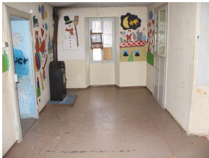
Küche und Wohnzimmer / cucina e pranzo