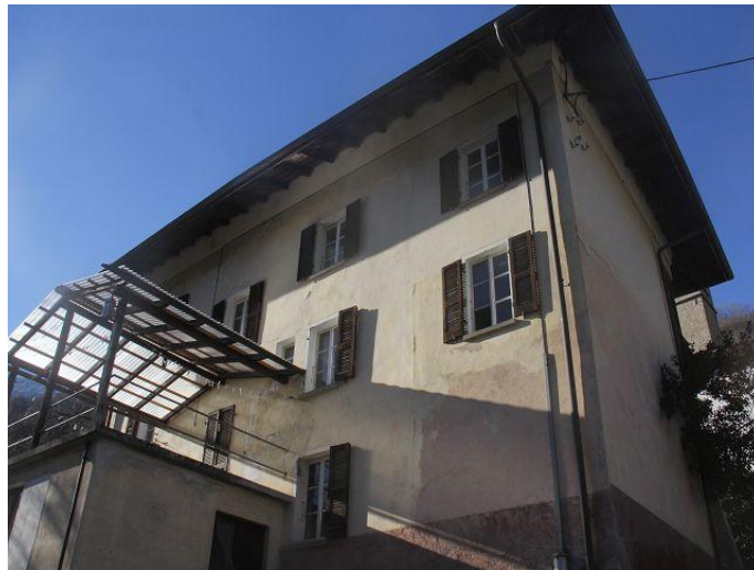
Haus / casa