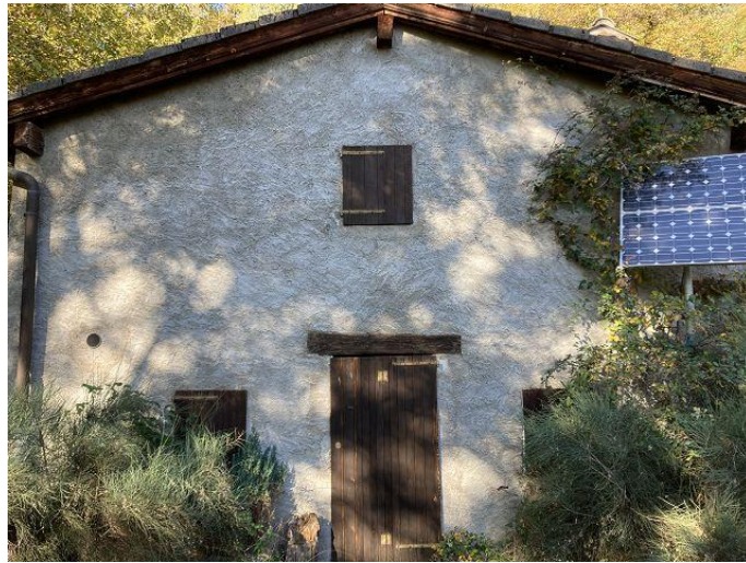
Rustico unten / Rustico sotto