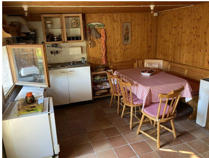
Essbereich mit Küche / pranzo e cucina