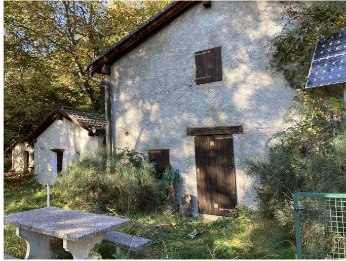
Drei Rustici unten / tre rustici sotto