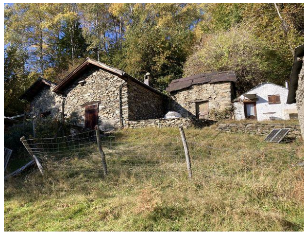
Blick zu den oben liegenden 6 rustici / vista verso le 6 rustici sopra