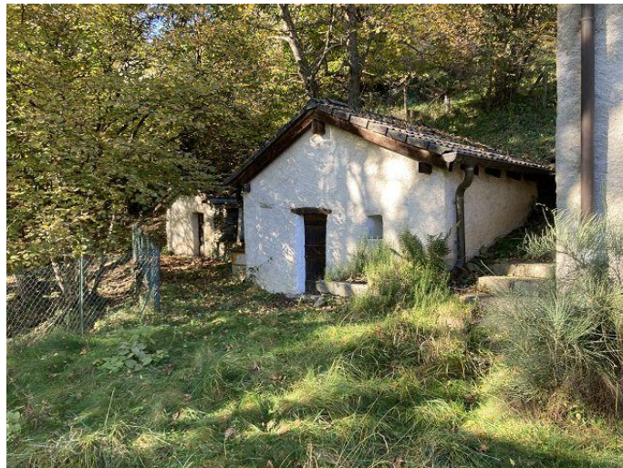
Rustici Dusche und Keller / rustici doccia e cantina