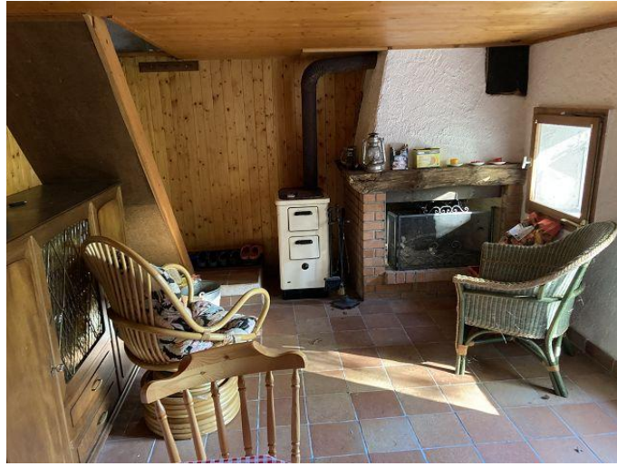
Wohnbereich mit Kamin / parte soggiorno con camino