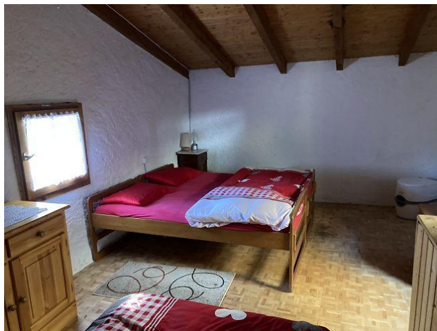
Dachraum / mansarda