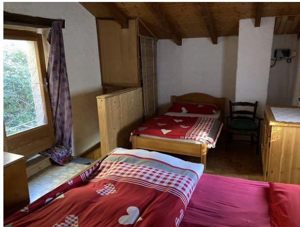
Dachraum / mansarda