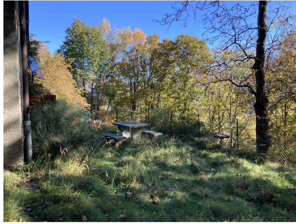
Sitzgruppe / cortile