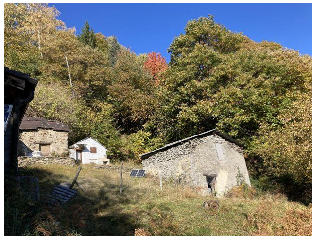
Blick zu den oben liegenden 6 rustici / vista verso le 6 rustici sopra