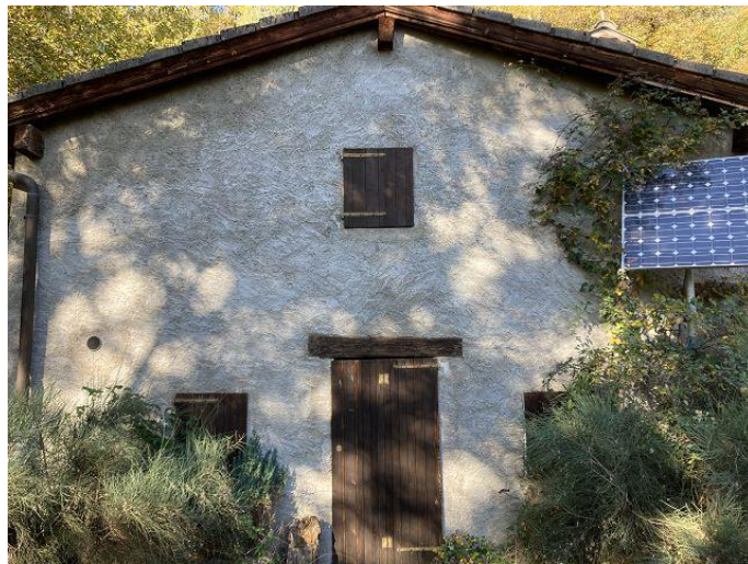
Rustico unten / Rustico sotto