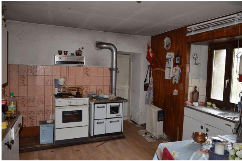
Wohnküche / cucina abitabile