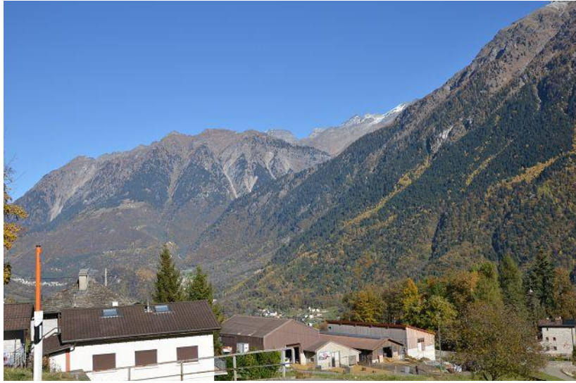
Blick nach Nord-Osten / Vista verso nord-est