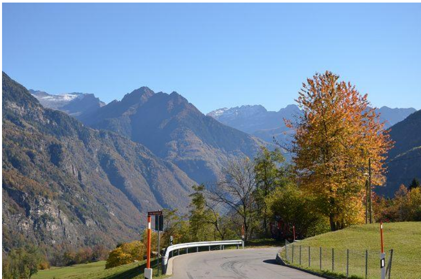
Blick nach Süden / vista sud