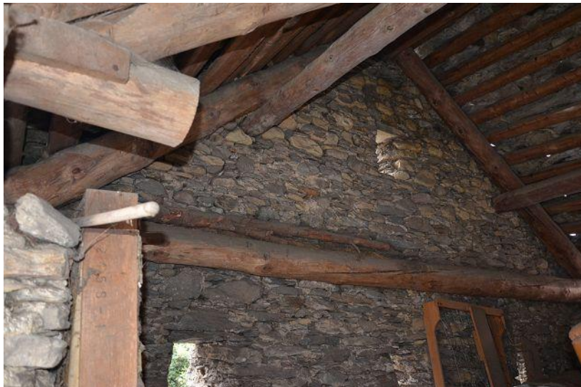
Dachraum Rustico / sotto tetto rustico