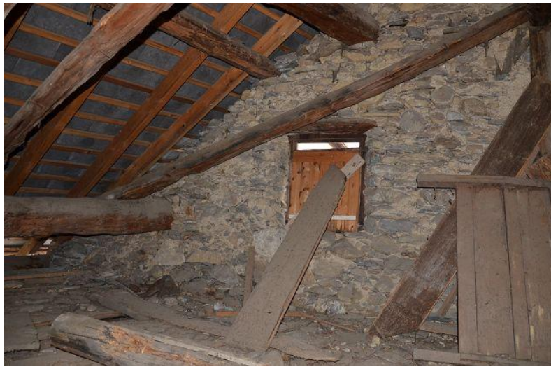
Dachstock Haus / solaio casa