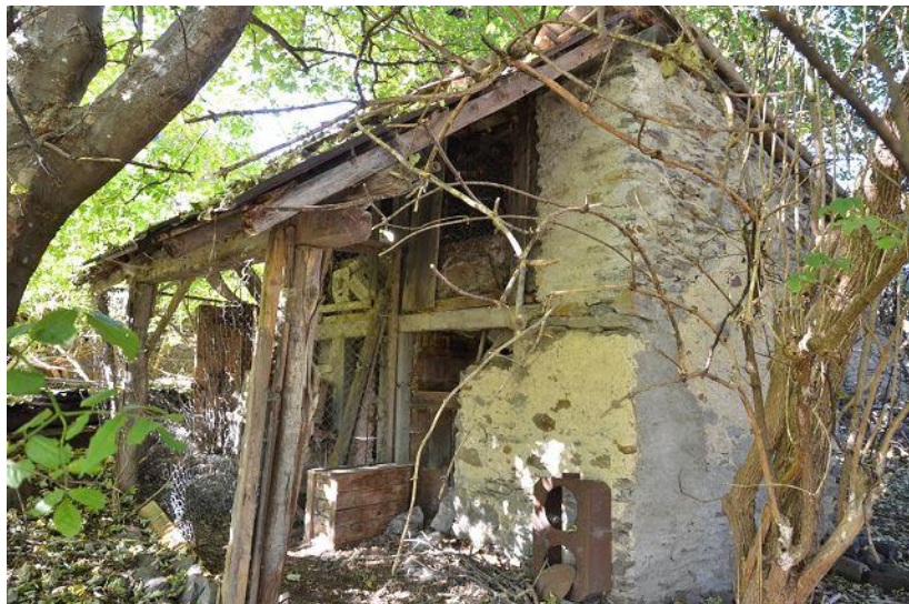
Stall / stalla