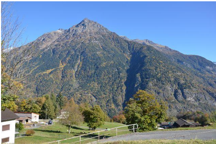
Blick nach Osten / vista est