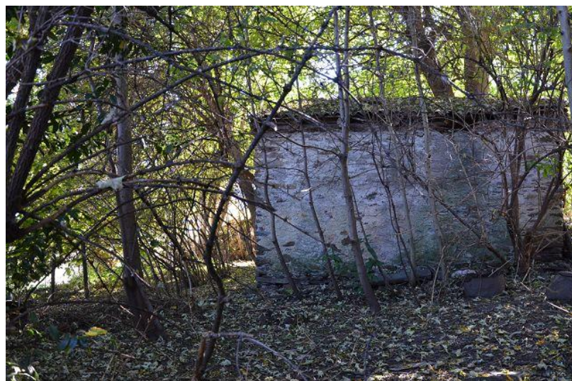
Stall / stalla