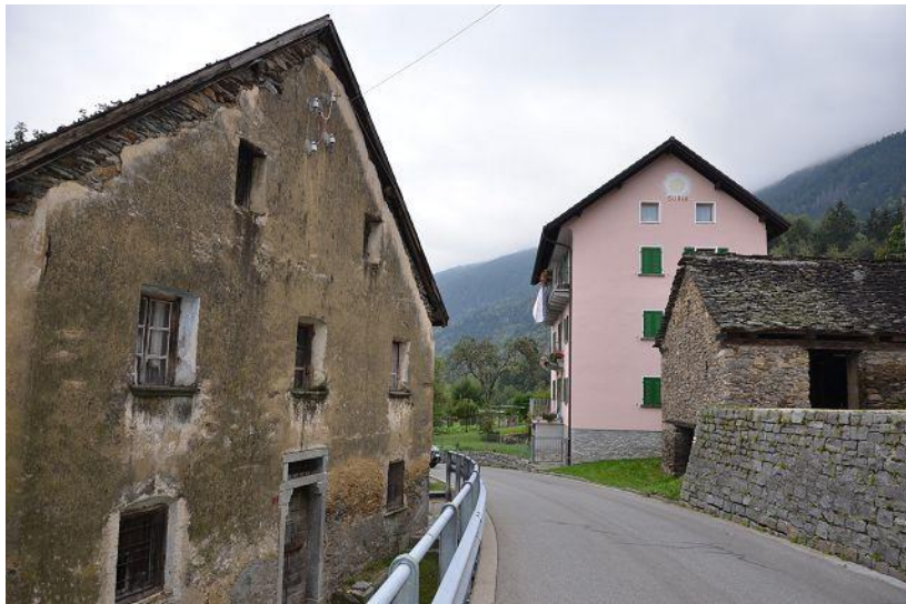
Haus / casa