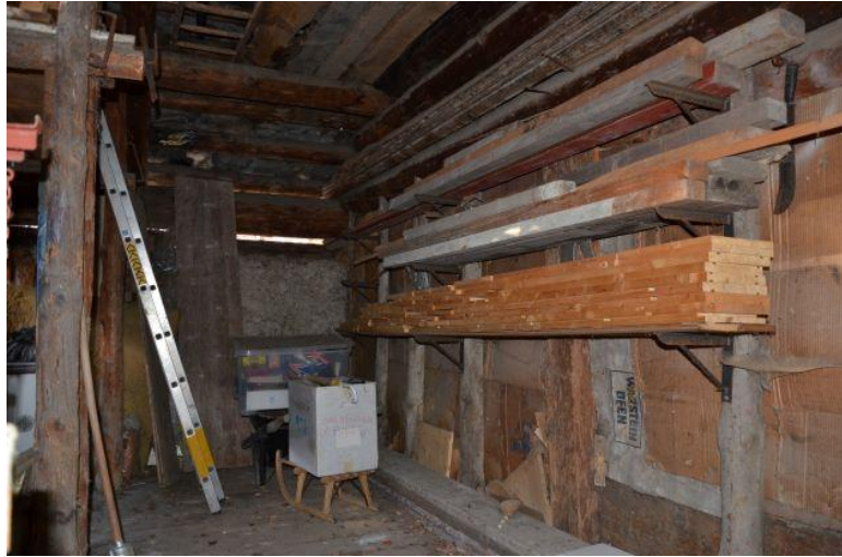
Innenraum Rustico 1 / Interno Rustico 1