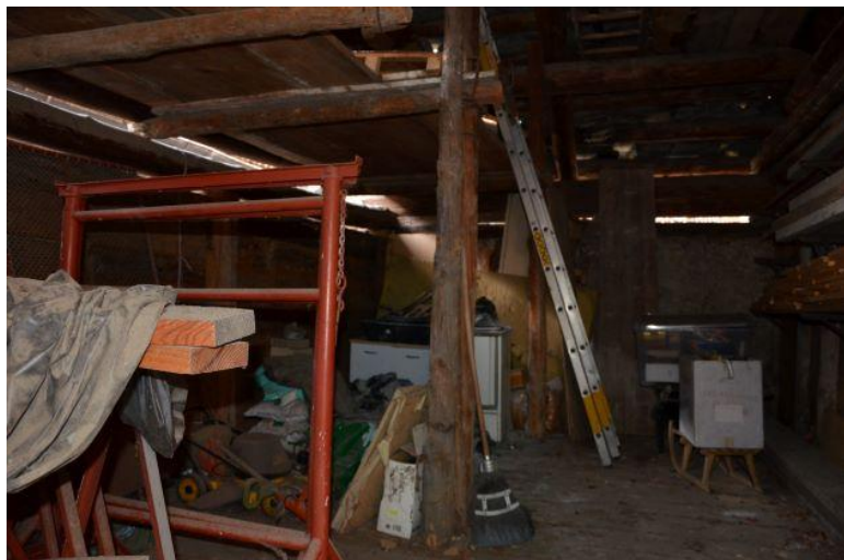
Innenraum Rustico 1 / Interno Rustico 1