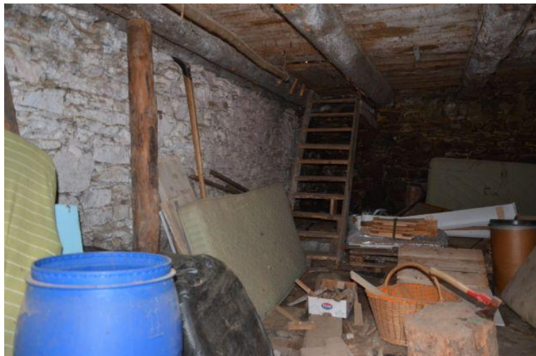
Innenraum Rustico 2 / Interno Rustico 2