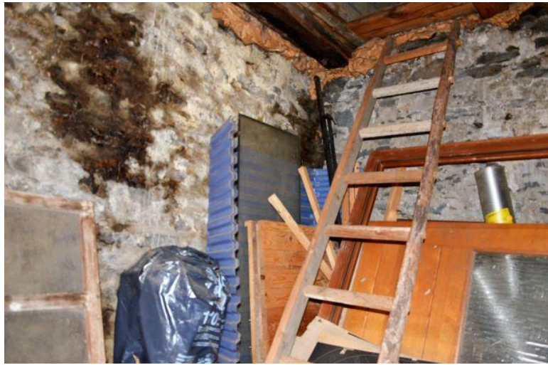
Innenraum Rustico 2 / Interno Rustico 2