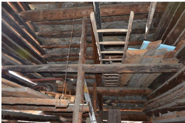
Innenraum Rustico 1 / Interno Rustico 1