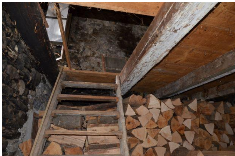
Innenraum Rustico 2 / Interno Rustico 2