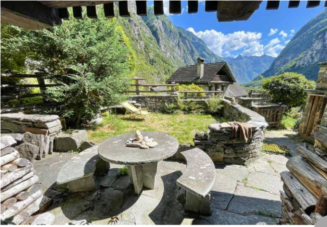
Sitzplatz mit Garten