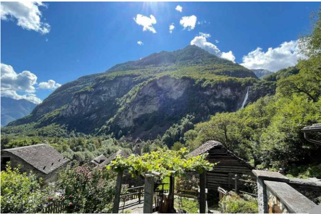
schöne Aussicht und Umgebung