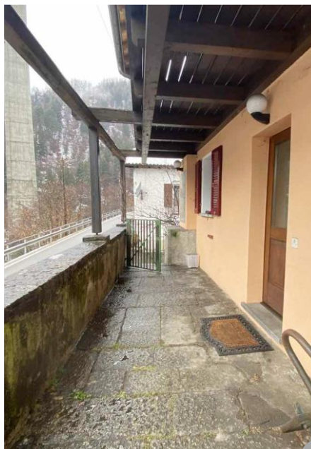
Eingang, Küche mit Steinkeller ● entrata, cucina con cantina