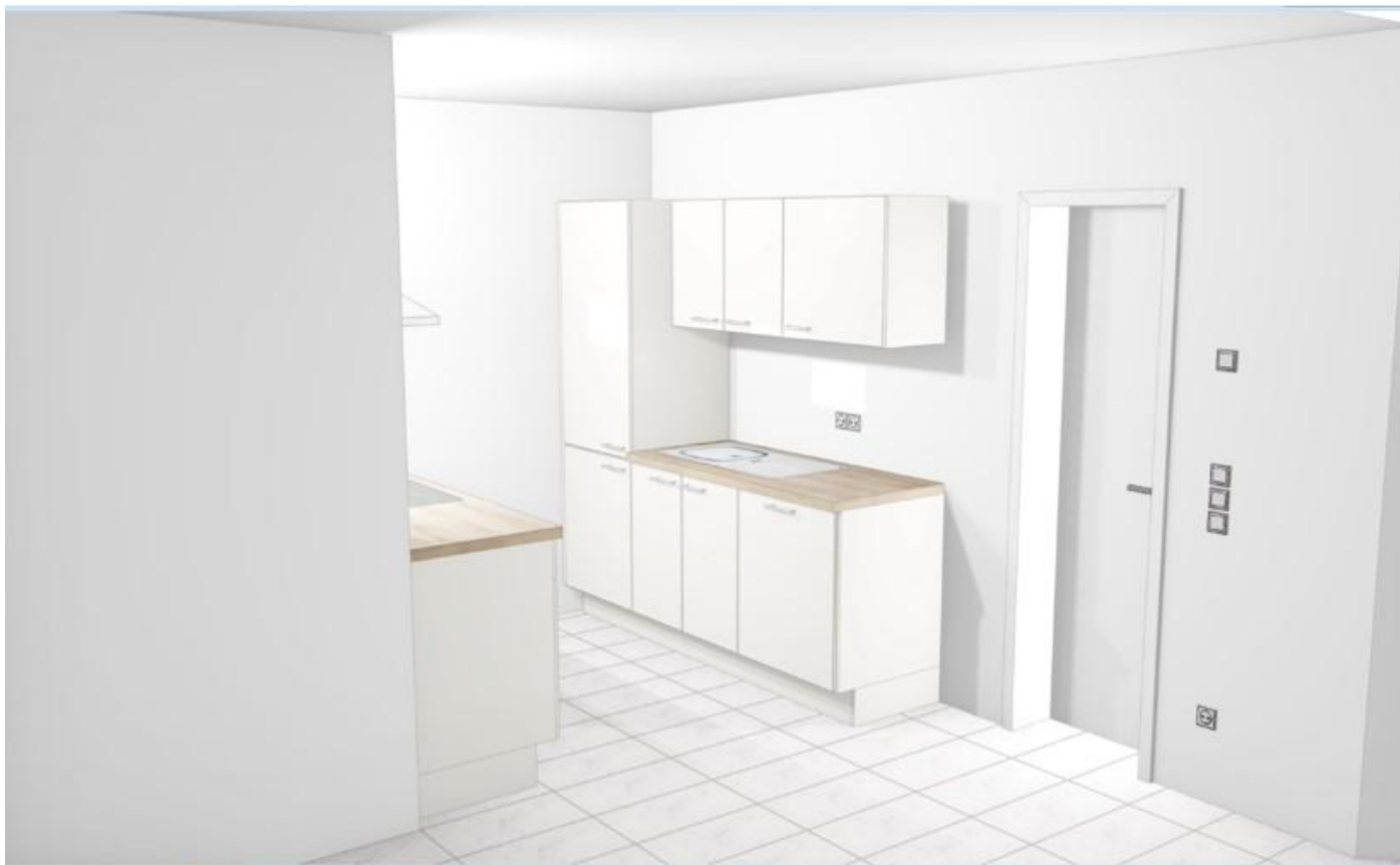
Wohnraum mit abgeteiltem Schlafbereich - TOP 7