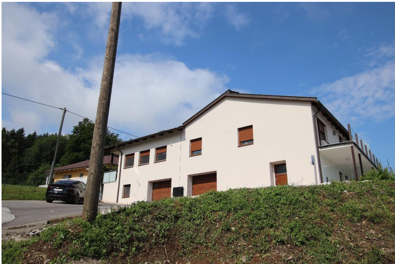
PV Anlage am Dach- 2 KWP