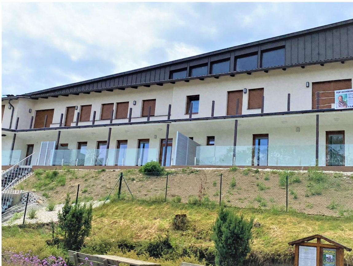
Ansicht Gebäude KFZ AP