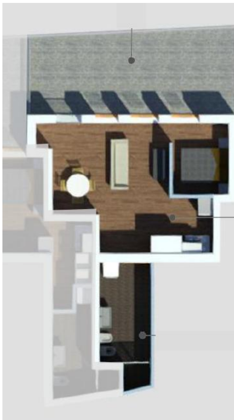
Grundriss TOP 7