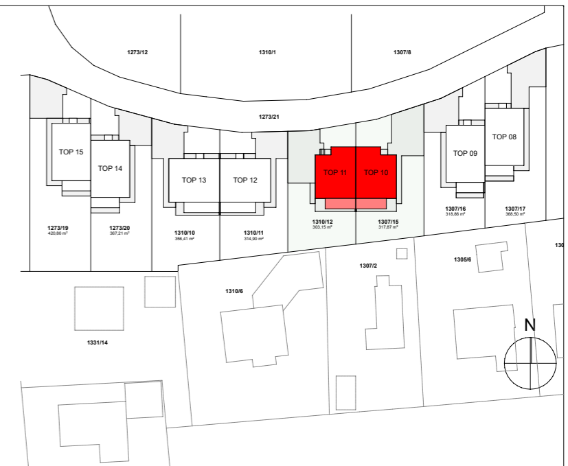
LAGEPLAN M 1:1000